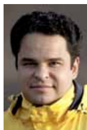
18h15 - Fotografia Noturna Cristiano Xavier