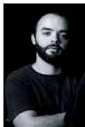
17h - Copa América Bruno Magalhães