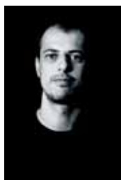
17h - Copa América Marcos Desimoni