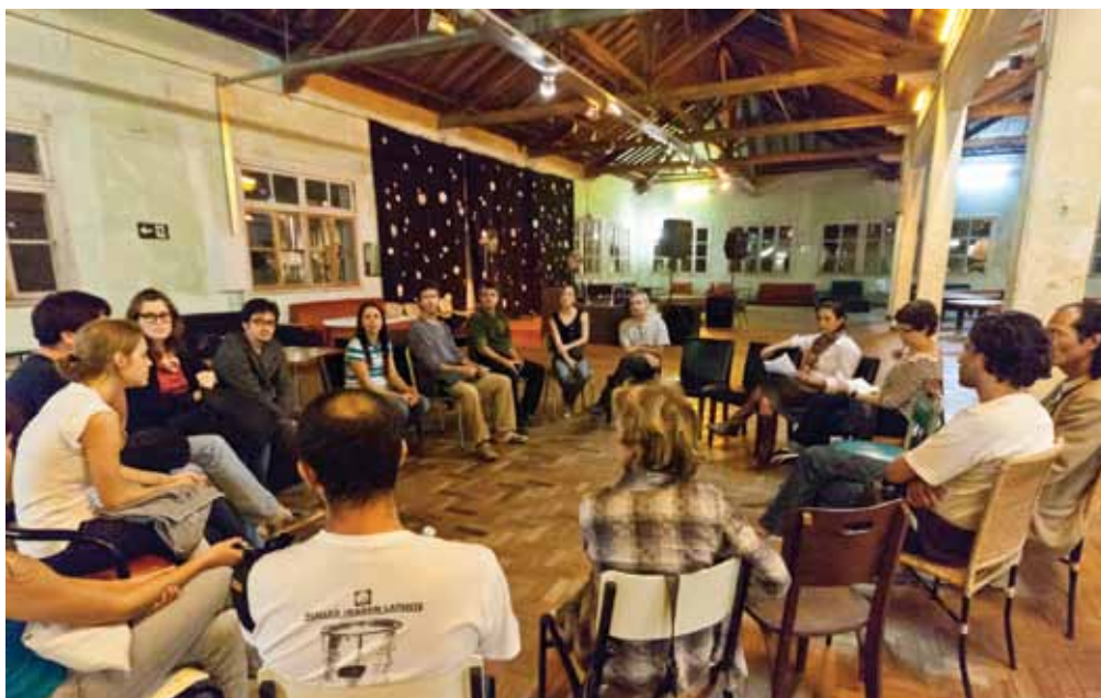
Uma das inúmeras reuniões de organização do evento

A fotografia mineira vive um momento de particular efervescência. A criação do Fórum Mineiro de Fotografia Autoral em janeiro de 2010 conseguiu reunir e mobilizar um grupo de fotógrafos dispostos a discutir políticas públicas voltadas ao fomento da atividade na cidade e no Estado. Os frutos desta mobilização surgiram ainda no ano passado, quando a parceria entre o Instituto Moreira Salles e a Secretaria Estadual de Cultura veio em resposta aos anseios da classe pelo não fechamento do IMS, em Belo Horizonte.